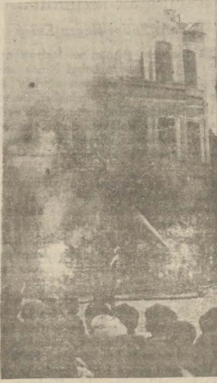
Yangından bir intiba

Dün akşam saat 19 da Sirkeçide Bahçekapı tramvay caddesinde bir yangın olmuş, 2 dükkân içindeki eşyalarla birlikte yanmıştır.